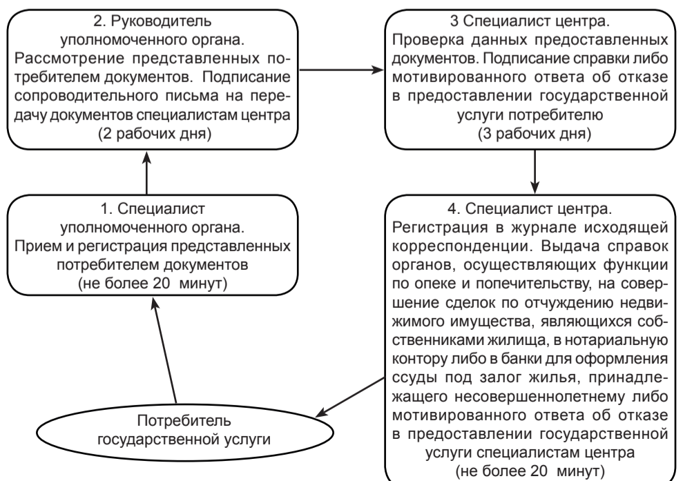
Схема, отражающая взаимосвязь между логической последовательностью административных действий

Приложение 2 к регламенту государственной услуги «Выдача справок органов, осуществляющих функции по опеке или попечительству, для оформления сделок с имуществом, принадлежащим на праве собственности несовершеннолетним детям»