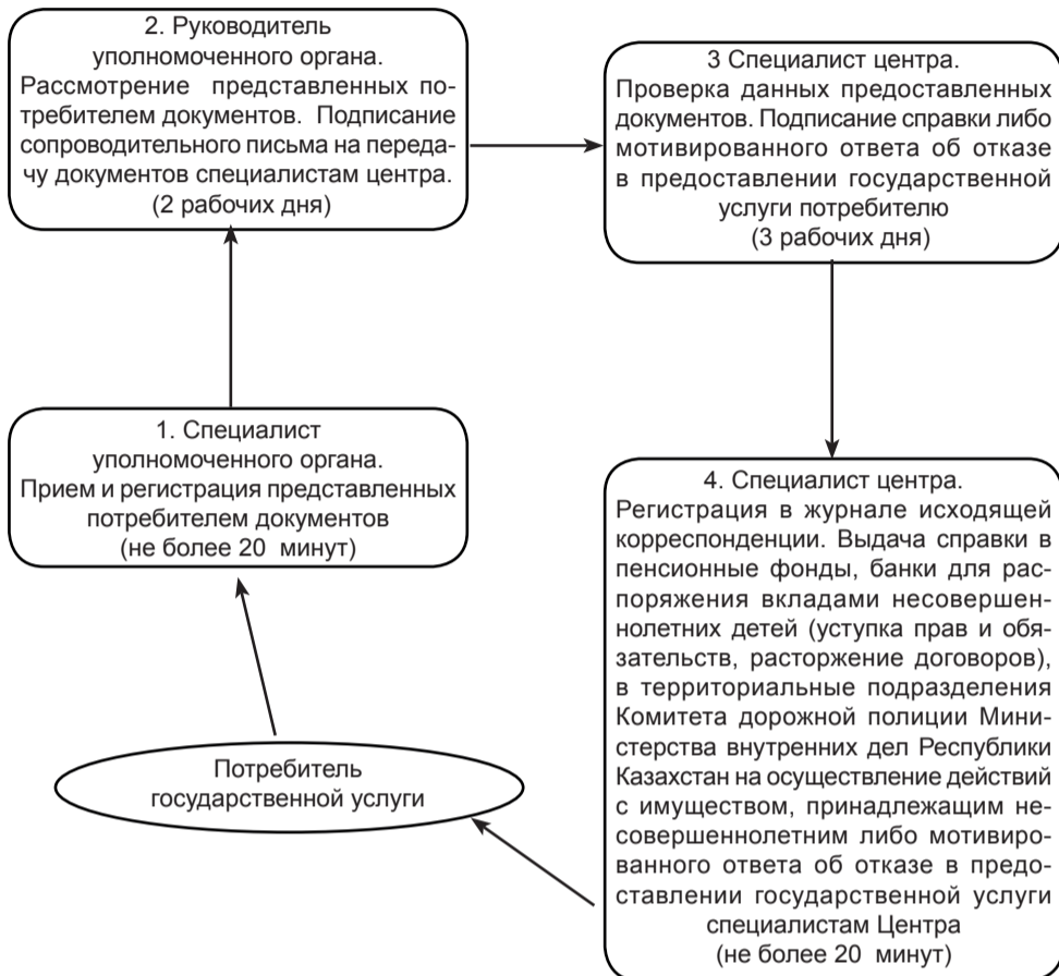
Схема, отражающая взаимосвязь между логической последовательностью административных действий

Утвержден постановлением акимата Успенского района от 28 ноября 2012 года №366/11