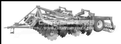
БДН-2,4; БДП-3,2; БДМП-4*4; БДМП-6*4 - 3 570 000 тт; БДМП-8*4 - 4 750 000 тт

Трактор ХТА-220-10 (175-250 л.с.); Трактор Беларус МТЗ всех модификаций; Жатки ЖВН-6В-9 м, ЖВП-9.1; 6.4; 4.9 м, ЖВЗ-10,7 м; Сеялки травяные, зерновые, пропашные; Культиватор междурядной и сплошной обработки; Пружинные бороны от 15 до 24 м; Плуги 3-х, 4-х, 5-6 корпусные; Чизельные от 2 до 7 м; Манипулятор - 3 т. Гидравлическая стрела тракторная ГСТМ-1000; Косилки роторные, дисковые, однобрусные; Разбрасыватели минеральных органических удобрений; КУН высота подъема (3,6 и 4,2) м; Зернометатели 90-110 т/ч; Очиститель вороха ОВС-25; Опрыскиватели навесные, прицепные, штанговые 12-21,7 м, V 600-2 500л.; Прицепы тракторные 4-12 тонн; Запчасти на почвообрабатывающую технику отечественного и иностранного производства (диски, лапы, лемеха, отвалы).